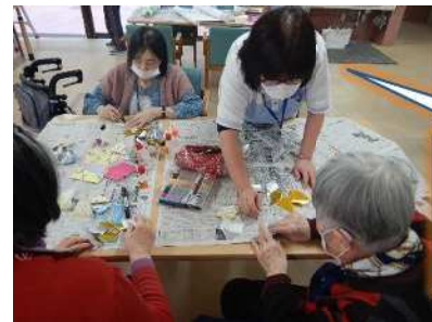
入居様と飾り付け(^^)